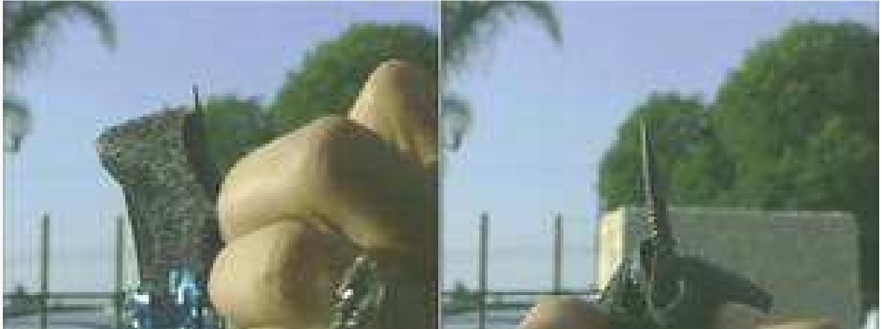
Punta metálica encontrada bajo el velcro al final de banderilha , usada en corridas de toros 'incruentas' en California

Cuando la industria taurina empezó a extender las corridas al estilo norteamericano más allá de California, organizaciones de protección animal empezaron a investigar este tipo de corridas “incruentas” en más detalle. El resultado fue revelador, pero no sorprendente. En dos investigaciones separadas, una en una corrida de toros en Artesia el 23 de mayo de 2009 y otra en Thornton una semana más tarde, la organización Animal Cruelty Investigations (ACI), afincada en Los Ángeles, descubrió que las banderilhas que supuestamente sólo deberían terminar en una punta de velcro que se pegaría a la tela del mismo material colocada en el lomo del toro en este tipo de corridas, escondían de hecho una verdadera punta metálica afilada.