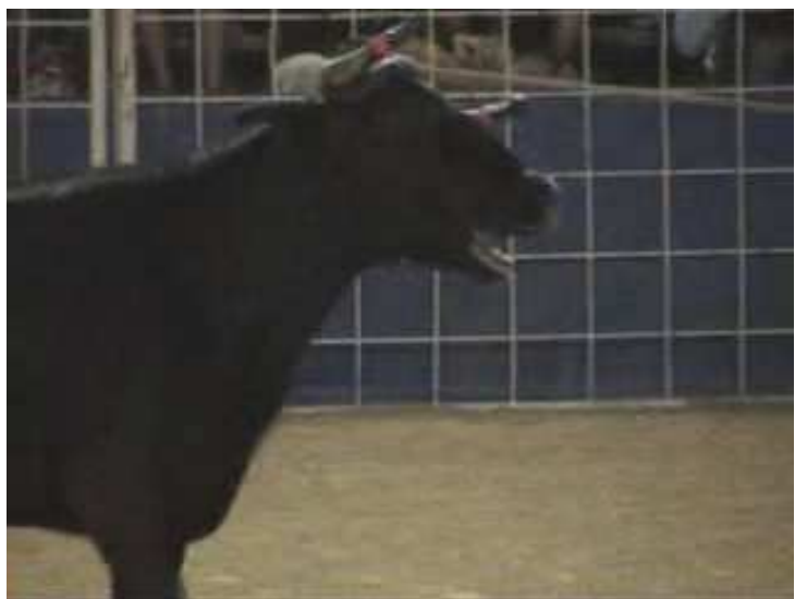
Vaca estresada durante una Course Landaise