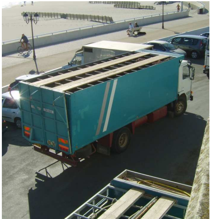
Camiones transportando toros para una Course Camarguaise

nunca ha vivido y no puede “comprender” ni por instinto ni por aprendizaje, se la coloca en celdas oscuras con olores relacionados con dolor y ruidos extraños y amenazantes y finalmente, con gritos, empujones y “pinchazos”, se le fuerza a correr hacia una supuesta “escapatoria” para encontrarse, en un choque que le causa un fuerte susto, en una arena rodeada de humanos chillantes y trompetas aterradoras, de la cual no puede huir ni refugiarse en ningún rincón. Cualquier mamífero, incluso los seres humanos, puestos en las mismas circunstancias sentiría sin duda temor, ya que el miedo es una emoción natural que ha evolucionado en todos ellos para intentar hacer frente a situaciones extrañas posiblemente peligrosas.