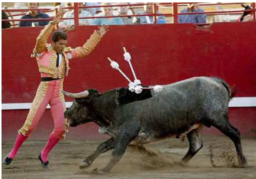
Corrida 'incruenta' norteamericana, mostrando la tela de velcro en el lomo del toro

equivalentes de velcro (los que, en teoría, no se clavan en la carne del toro sino que se pegaban en una tela de velcro en el lomo del animal). Unos años después, en 1999, el hijo de Borba, también torero, desarrolló ese estilo en una mini-industria taurina norteamericana con varias plazas de toros permanentes, ganaderías, escuelas taurinas, etc. Durante años se hicieron corridas de este tipo sin que el animalismo se quejara... porque en realidad el movimiento anti-toreo no tenía ni idea de que estas corridas existían (ni siquiera los grupos de protección animal californianos), dada la poca publicidad que hacían. Cuando la industria taurina internacional se dio cuenta de que la etiqueta de crueldad, después de tantos años, les había causado una crisis fuerte e imparable donde la mayoría de la población en países taurinos ya no le interesaba la tauromaquia, empezó a considerar la corrida incruenta norteamericana como una posible salvación a explorar para usarla como último recurso. Con apoyo de toreros de otros países, la industria americana empezó a expandirse a otros estados (Nevada, Illinois, etc.) y allí es donde el movimiento anti-toreo empezó a despertarse, lo que conllevó a investigaciones que al final revelaron que tales corridas ni son incruentas, ni son no-sangrientas, como era de esperar.