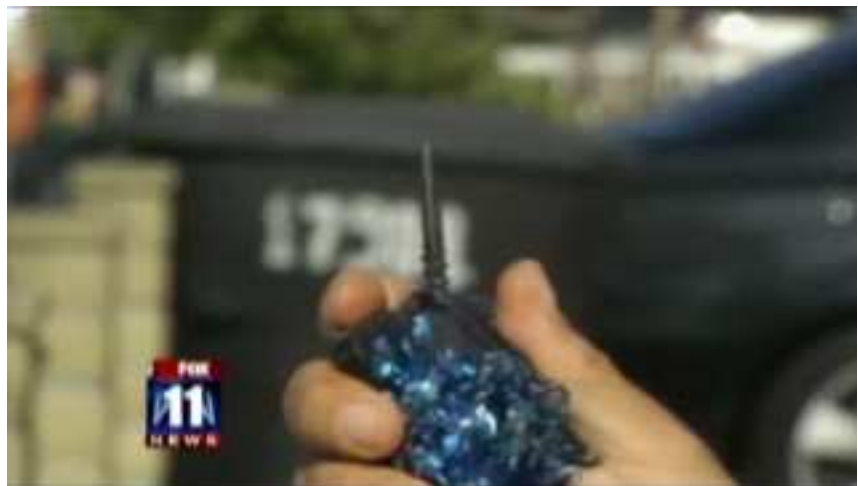
Punta metálica escondida debajo del velcro de una banderilla de una corrida norteamericana

Por lo referente a las corridas norteamericanas, uno esperaría que el uso del velcro haya eliminado completamente las heridas, y el término inglés de corridas “no sangrientas” esté justificado. Sin embargo, como veremos más adelante, una investigación encubierta hecha por el movimiento animalista en el 2009 mostró como detrás del velcro de la banderilla hay una punta metálica real que se clava en la espalda del toro produciéndole heridas, aunque la sangre que se produce es absorbida por la tela “negra” en el lomo del animal, y por tanto el público no la ve. También, muchos de los toros toreados en este estilo no se pueden volver a torear –ya que el toro no solo va a colaborar menos en otras ocasiones futuras dada su buena memoria, sino que va a ser más peligroso porque su experiencia lo hace menos vulnerable al “engaño” del torero– y por tanto también son sacrificados después de la corrida (no sabemos exactamente cómo, ya que no lo hacen públicamente).