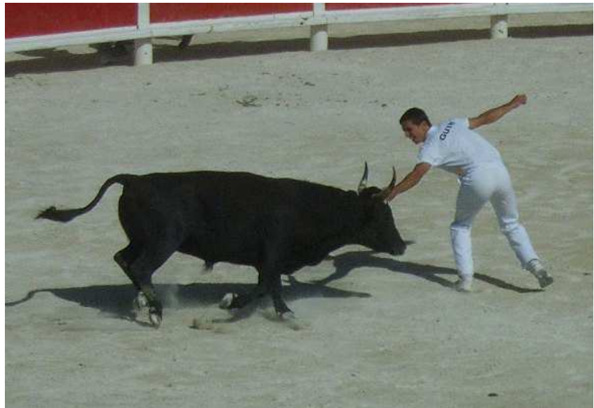
Course Camarguaise

1951 el Código Penal de Francia, después de cien años de debate legal, prohibió las corridas de toros al estilo español, pero solo si se realizan en áreas de Francia donde no son tradicionales.