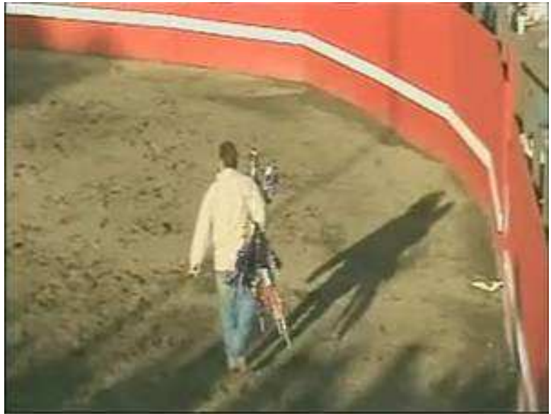
Agente de protección animal de ACI confiscando las banderilhas usadas en la corrida 'incruenta' norteamericana

Desde esta “revelación”, el avance de las corridas “incruentas” a través de América se detuvo y muchas de las corridas que se había programado en otros estados se cancelaron. Las investigaciones continúan, ya que ahora que el movimiento animalista de los EEUU ya conoce su existencia, sin duda va a haber más.