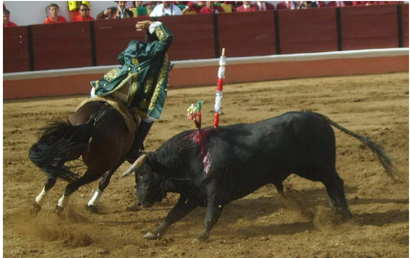
Corrida de toros estilo portugués (touradas)

siguiente la reina de Portugal Doña Maria II prohibió por Real Decreto la muerte del toro en público durante las corridas de toros realizadas en ese país. La prohibición duró poco tiempo, pero se volvió a aprobar en 1928. Sin embargo, esto no eliminó la crueldad de la corrida portuguesa ya que los taurinos siguen matando al toro en privado (a veces dos o tres días después de la corrida, dejando al toro herido y ensangrentado sufriendo durante todo ese tiempo en aislamiento), sustituyeron la puya tradicional por un rejón de castigo que infringe un daño similar, y se siguen usando las banderillas, que aumentaron de tamaño y por tanto desde entonces causan más dolor.