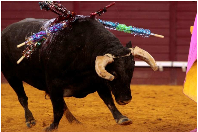
Cuernos cubiertos con cuero en una corrida Portuguesa

Por ejemplo, el caso del “afeitado”, donde se liman las puntas de los cuernos para disminuir el peligro de una cornada. Esta práctica, prohibida por los reglamentos taurinos de los países donde se practica la corrida al estilo español, se ha seguido practicando, y de vez en cuando se ven noticias de ganaderos u otros profesionales taurinos multados por tal infracción. Por otro lado, tales prácticas son legales en Portugal, donde no solo se pueden limar los cuernos sino que también se les ponen fundas de cuero, especialmente para evitar que los toros hieran a los caballos, que no tienen otra protección. Pero la pregunta que nos debemos hacer es que, si algunas de estas modificaciones realmente ocurren, a pesar de ser en contra de la normativa y de la “reputación” de los toreros involucrados, y a pesar de que los toros ya se debilitan intensamente con las banderillas, la pica, o el rejón de castigo, ¿no sería de esperar que ocurrirían aun más en aquellas corridas donde no se pica ni se banderillea al toro? Si realmente existe un elemento de “toreros cobardes” que pretenden ser valientes atacando a un toro que ha perdido aun más la capacidad de defenderse por la “manipulación” que ha recibido, ¿no sería de esperar que éstos usaran aun más manipulaciones en las corridas catalogadas como “incruentas”, donde el toro está más “fresco”?