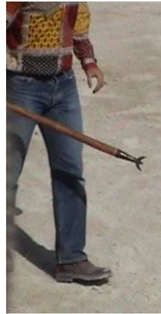
Izquierda: Crochet. Derecha: tridente usado para pinchar a toros en una Course Camarguaise.

del espectáculo), con lo que es frecuente que se use el tridente para forzar al toro a regresar a la arena. También se pueden crear lesiones de forma accidental con el crochet , el utensilio metálico que los toreros (llamados raseteurs ) llevan en la mano para cortar los cordeles que el toro lleva atado a la base de sus cuernos, mientras corren delante del toro evitando su embestida.