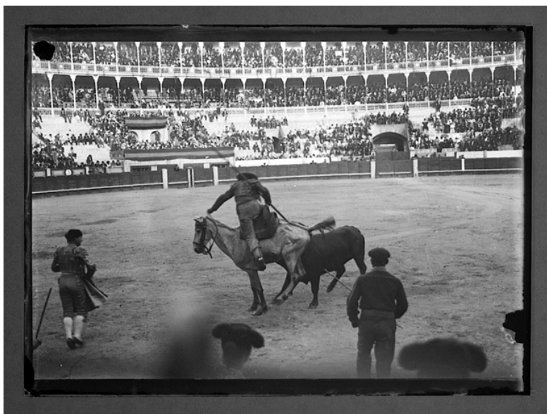
Corrida de toros anterior a la obligación del uso de peto en los picadores

La siguiente reforma significativa fue hecha en la década de 1920 cuando se empezó a exigir el uso de petos en los caballos de picadores en todos los países donde se toreaba al estilo español. Como la muerte del caballo en frente del público era común, y el movimiento de protección animal que había empezado varias décadas antes empezó precisamente como