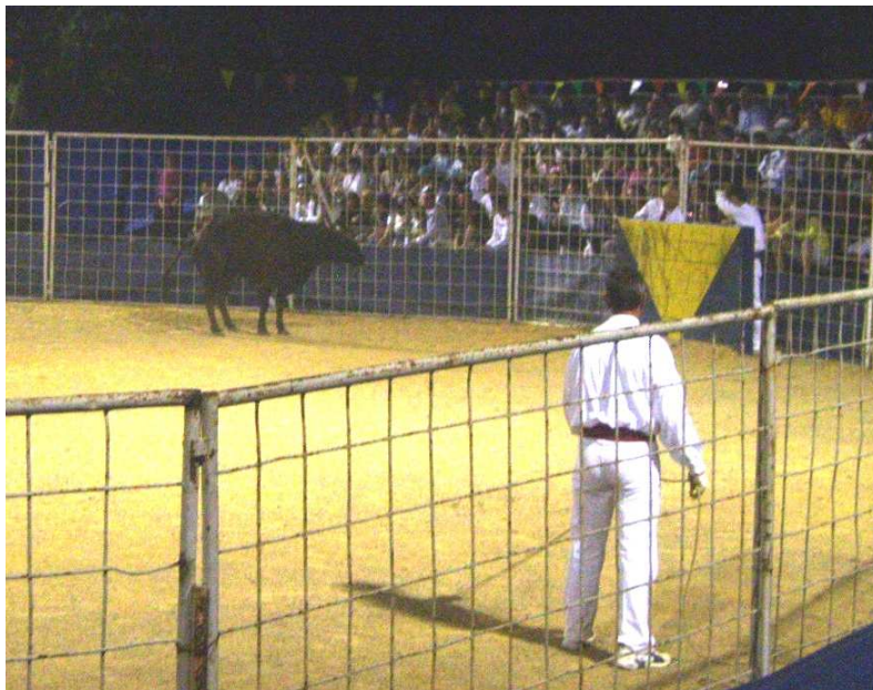
Course Landaise

La corrida al estilo español fue importada a Francia en 1835, cuando se dio en Bayona una corrida en honor a la Emperatriz Eugenia de Montijo (una aristócrata española esposa de Napoleón III), pero la etiqueta de “crueldad” impidió que la industria taurina se expandiera al centro y norte del país, donde los efectos de la Ilustración aun eran fuertes. Cuando, con la Ley de 1951, el rechazo a las corridas de toros “de muerte” en Francia las clasificó como un crimen en la mayoría del país, la industria necesitaba más que nunca una mejora de su imagen, con lo que se “alió” con las corridas autóctonas, protegidas de mala fama por su carácter francés, y porque por esa época no se las consideraba crueles. Así pues, desde entonces, en determinados municipios de Landes y la Camargue (ambas regiones del sur de