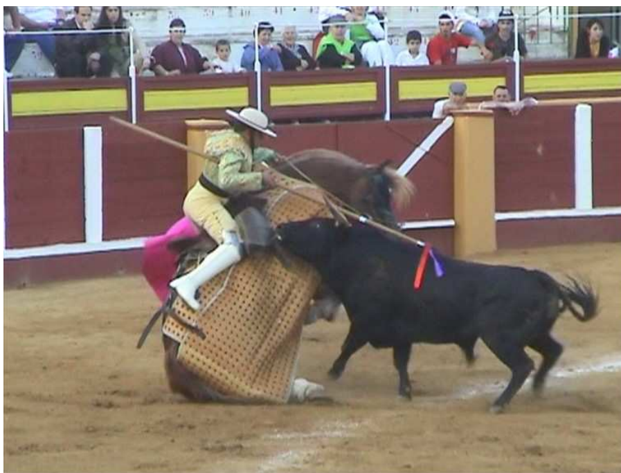
Toro derribando al caballo de un picador

Y no nos debemos de olvidar de los caballos, la otra víctima de la tauromaquia. Se usan en las corridas Quiteñas para los picadores, y en las portuguesas y norteamericanas para los cavalheiros . En las primeras, como en las corridas españolas, a pesar de que llevan un peto que en teoría les protege de la embestida del toro, a veces tal protección es insuficiente, y el toro derriba al caballo acabando embistiéndolo en aéreas desprotegidas, añadiendo heridas reales (a veces mortales) al temor que el caballo padece desde el momento en que un ser invisible –ya que le cubren los ojos al caballo para que no lo vea– le embiste con toda su fuerza.