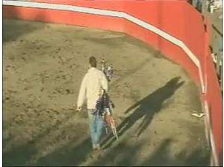
Agente de protección animal de ACI confiscando las banderilhas usadas en la corrida 'incruenta' norteamericana

Desde esta “revelación”, el avance de las corridas “incruentas” a través de América se detuvo y muchas de las corridas que se había programado en otros estados se cancelaron. Las investigaciones continúan, ya que ahora que el movimiento animalista de los EEUU ya conoce su existencia, sin duda va a haber más.