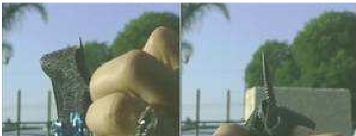
Punta metálica encontrada bajo el velcro al final de banderilha , usada en corridas de toros 'incruentas' en California

Cuando la industria taurina empezó a extender las corridas al estilo norteamericano más allá de California, organizaciones de protección animal empezaron a investigar este tipo de corridas “incruentas” en más detalle. El resultado fue revelador, pero no sorprendente. En dos investigaciones separadas, una en una corrida de toros en Artesia el 23 de mayo de 2009 y otra en Thornton una semana más tarde, la organización Animal Cruelty Investigations (ACI), afincada en Los Ángeles, descubrió que las banderilhas que supuestamente sólo deberían terminar en una punta de velcro que se pegaría a la tela del mismo material colocada en el lomo del toro en este tipo de corridas, escondían de hecho una verdadera punta metálica afilada.